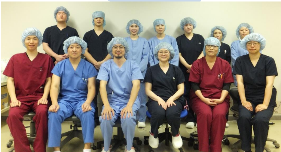
手術室の看護師スタッフ一同

完全内視鏡下MICS手術は創部がより小さいく済むことから、出血量・輸血量が少なく、術後の傷も小さく目立ちにくくなります。また、通常の開胸手術のように、胸骨を切開しないので、術後のリハビリテーションも早期から取り組むことができ、早期の退院と社会復帰をめざすことができます。