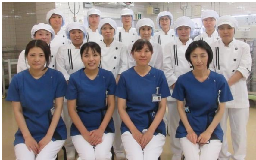
薬剤・栄養グループ栄養課の管理栄養士・調理士

現在、栄養科職員は1/3が20代以下の若いチームです。経験不足の面もあるとは思いますが、管理栄養士を中心に、患者さまに日々の食事を喜んでいただけるよう努めて参ります!