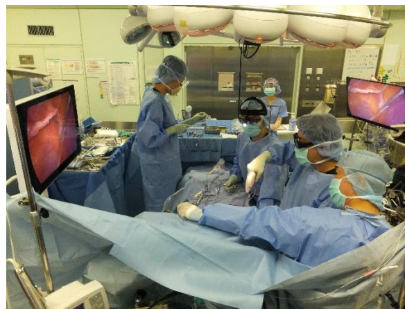
3D4K内視鏡を使った低侵襲心臓外科手術